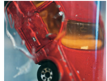
Entwurf »Drowning Car« im Teich des Volkspark Schöneberg bzw. im Wasserbecken unterhalb des Victoria-Parks in Kreuzberg